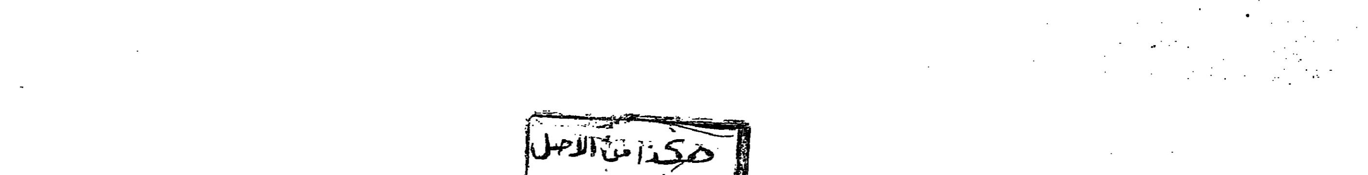
هكذا من الاعمال